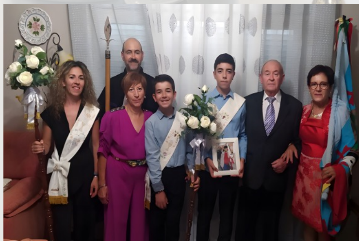
FAMILIA TALAVERA-DE LA CRUZ ABANDERADA MENOR