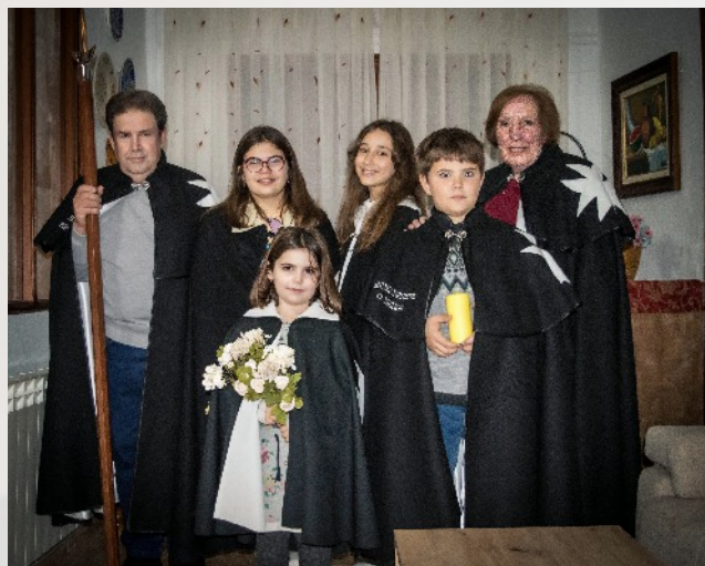
FAMILIA PATIÑO-FERNÁNDEZ CAPITANA MENOR